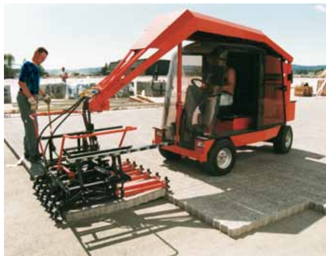
Maskinlægning med løftetang på specialmaskine, kan også monteres på minigraver, minilæsser mv.

Betonvareproducenten er ikke ansvarlig for den aktuelle overholdelse af arbejdsmiljøreglerne, herunder for byggepladsen, idet det er den udførende entreprenør, der bærer dette ansvar. Som anført, skal der ved arbejdets forsvarlige udførelse tages hensyn til konkrete faktorer som vejr og vind, underlagets tilstand og egnethed, korrekt løfteteknik, tempo, arbejdsstilling, arbejdets varighed mm.