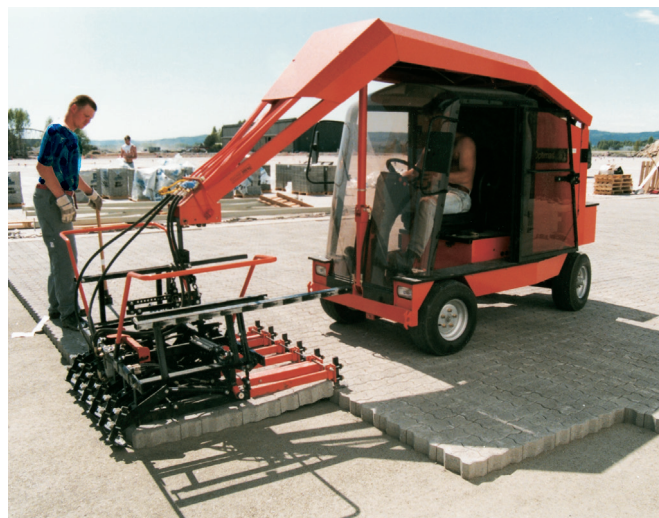
Maskinlægning med løftetang på specialmaskine, kan også monteres på minigraver, minilæsser mv.

Betonvareproducenten er ikke ansvarlig for den aktuelle overholdelse af arbejdsmiljøreglerne, herunder for byggepladsen, idet det er den udførende entreprenør, der bærer dette ansvar. Som anført, skal der ved arbejdets forsvarlige udførelse tages hensyn til konkrete faktorer som vejr og vind, underlagets tilstand og egnethed, korrekt løfteteknik, tempo, arbejdsstilling, arbejdets varighed mm.